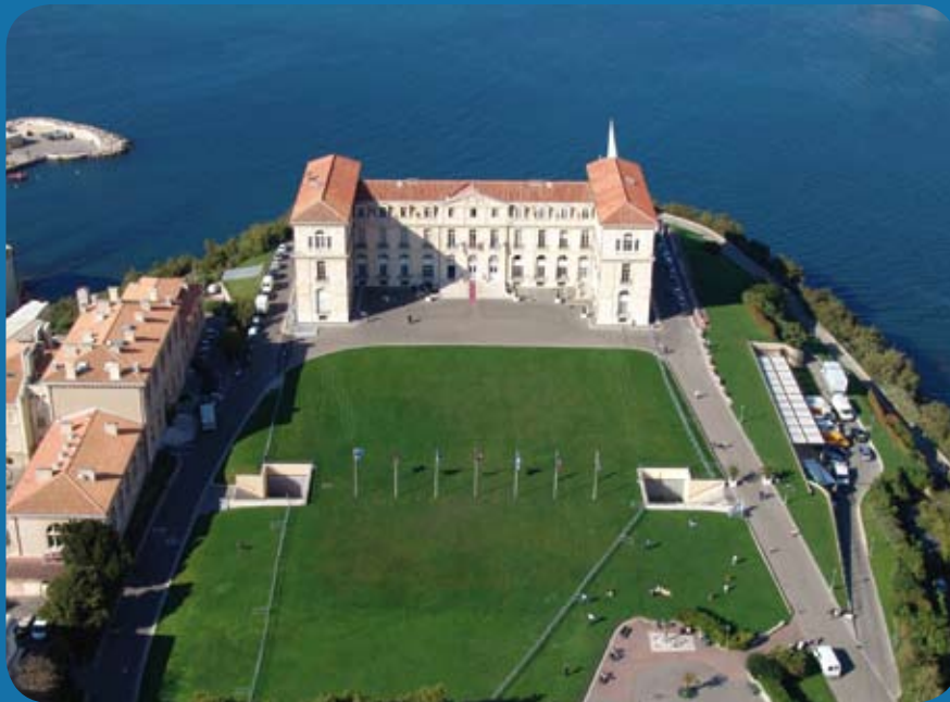
PALAIS DU PHARO 58, boulevard Charles Livon 13007 Marseille